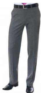
PANTALON HOMME AVALINO