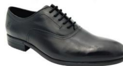
CHAUSSURE DE SERVICE HOMME NCHIC

Pantalon sans pinces Deux poches avant Une poche arrière Lavable en machine