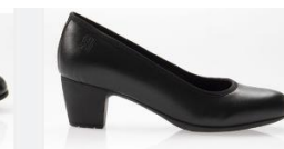
ESCARPIN DE SERVICE SANDY