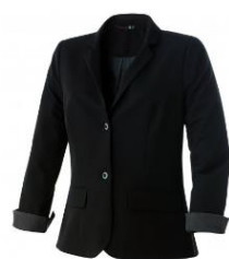
VESTE FEMME UTICA

Pour les femmes : Veste / Pantalon / Escarpin = noir - Chemisier = blanc