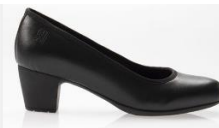
ESCARPIN DE SERVICE SANDY