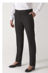
PANTALON FEMME UBAS

Veste doublée Devant fermé par boutons cousus Col tailleur Manches longues avec fentes Bas de manches intérieurs de couleur Découpe princesses devant Poches basses avec rabat Découpe milieu dos Pincés dos