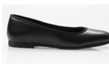
ESCARPIN DE SERVICE SARA

Chemisier en majoritaire coton Manches longues Coupe ajustée Lavable en machine