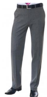
PANTALON HOMME AVALINO Référence : BRAVALINO

Pantalon sans pinces Deux poches avant Une poche arrière Lavable en machine