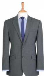
VESTE HOMME AVALINO Référence : BRAVALINOVESTE

Deux boutons Coupe ajustée Deux fentes à l'arrière Trois poches intérieures Poche téléphone portable Lavable en machine